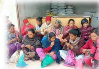
EJAAD アフガニスタン伝統の刺繍