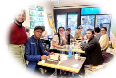
HAND IN HAND の集い

新型コロナウイルス・パンデミックが世界を覆い尽くして、もう3年目となりました。その間、経済格差、政情不安、自然災害など深刻な問題が多発し、暮らしが成り立たなくなった多くの人々が世界に溢れています。大切な緑の地球に住む私たちはみんな繋がっていて、他人事では済まされないと心痛みます。コロナ禍のために活動はいろいろ制限はあっても、こんな時こそ一層、TIFAの活動は力強くありたいと思っています。コロナ禍で大きな影響を受けながらも、地域で暮らす多くの外国人の人たちと力を合わせて、苦難を乗り越えようと努力する人々にエールを送り、様々なことを学びながら、今できる限りの活動を続けています。今号は、コロナ禍での外国人のための4つのプログラムにスポットを当てました。