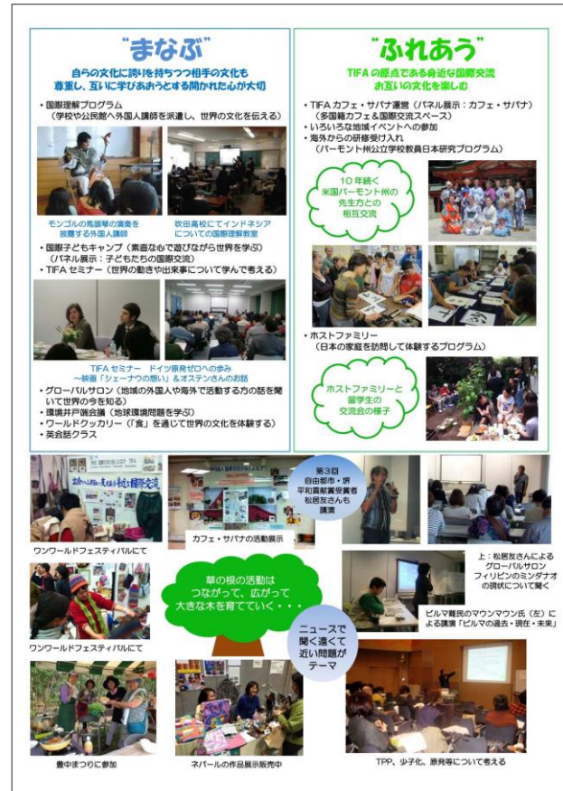
活動紹介パネル(堺市作成 8枚のうちの1枚)

私たちの暮らす社会の多文化、多民族化は飛躍的に進んでいます。未だに言語・文化・習慣等の違いから外国人の多くが様々な課題を抱えています。そのような中、同団体は、誰もが安心して暮らすことができる平和社会の実現は、市民一人ひとりの交流から育まれるとの考えから、外国人住民との個々の交流を通じた、生活に密着したきめ細かな支援を続けてこられました。また、1993年からは地域的な課題を世界の人たちと協力して解決しようと、ネパールシズリ地方での女性と子どもの自立支援活動を展開し、多民族・多文化共生社会の実現に大きく寄与されていることを高く評価します。