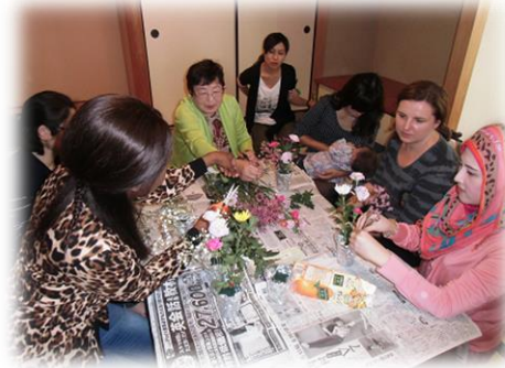
みんなで楽しくフラワーアレンジメント

赤ちゃんの時から参加している子ども達が成長して、活動の後、何も言わないのに自分からおもちゃ箱や敷物をロッカーへ片づけてくれるようになりました。