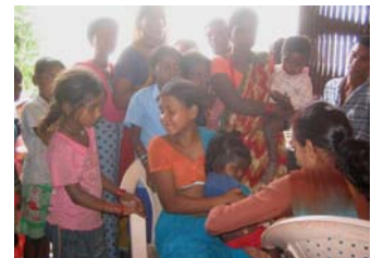
ドダウリ診療所での予防接種の様子

第3部 懇談会 ネパール料理を一緒に楽しみながら、自由に話し合しましょう！ (食事代 500 円)