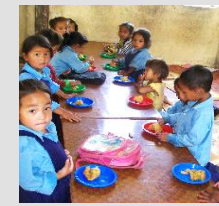
教育・給食支援をしているネパールの小学校

ネパールの農村部にて、子どもの教育支援や女性の生活を支援するための縫製技術指導などを、現地 NGO と協力して行っています。