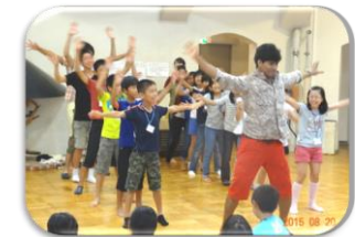
TIFA 国際子どもキャンプ