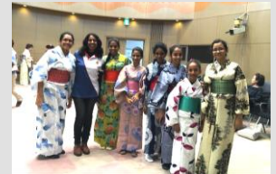
スリランカの学生との交流

地域に住む外国人から自国の家庭料理の作り方を教えてもらい、多様な食文化についてのお話を聞きます。