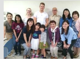
ホストファミリー対面式にて

TIFAの活動の原点である身近な国際交流を、楽しみながら続けています。海外からの文化交流の受入れなども行っています。