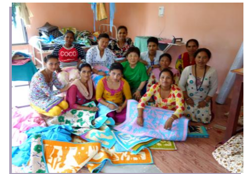
ネパール・ドダウリ村でのキルト作り