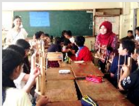
インドネシアの楽器体験

世界のさまざまな文化に対する理解を深め、グローバルな視野を育てるための活動です。