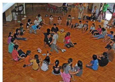
みんなでハンカチ落とし