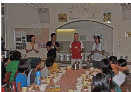
モルドバ語でいただきます。