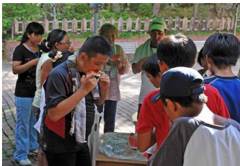
おやつのスイカはうまい！！