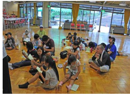
勉強時間 文化や言葉をならいました。