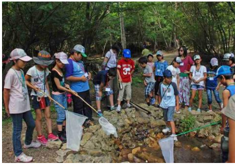
この池に何があるかな？