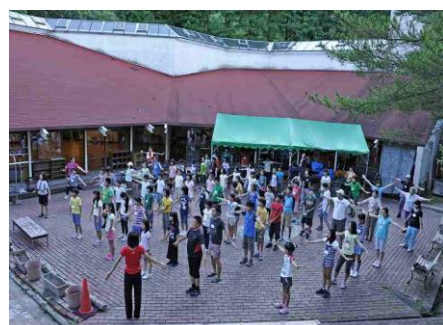
朝のつどい 体操して目を覚まそう