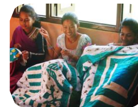
ネパール・ドダウリ村での キルト作り