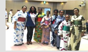
スリランカの学生の日本文化体験