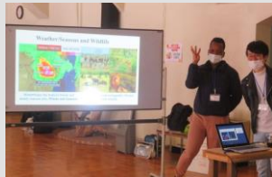
留学生から母国の話を聞く

世界のさまざまな文化に対する理解を深め、グローバルな視野を育てるための活動です。