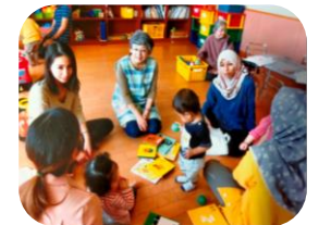
TIFA 多文化子育てサロン