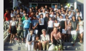
ウズベキスタンで日本語を学ぶ子どもたち

地域に住む外国人から自国の家庭料理の作り方を教えてもらい、多様な食文化についてのお話を聞きます。