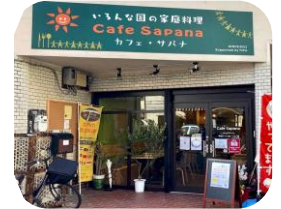
世界と出会う空間 カフェ・サパナ

Non Profit Organization Toyonaka International Friendship Association