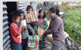
コロナ禍のネパールでの食料支援