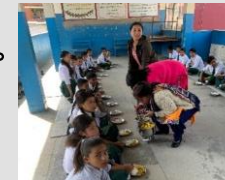
教育・給食支援をしているネパールの小学校

ネパールのブンガマティおよびドダウリ村にて、子どもの教育支援や女性の生活を支援するための縫製技術指導などを、現地 NGO と協力して行っています。