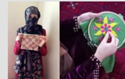
アフガニスタン EJAAD の刺繍作り

途上国の女性たちの手作りを日本で紹介、販売することにより、彼女たちの生活と自立を支援しています。