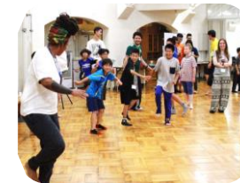
TIFA 国際子どもキャンプ